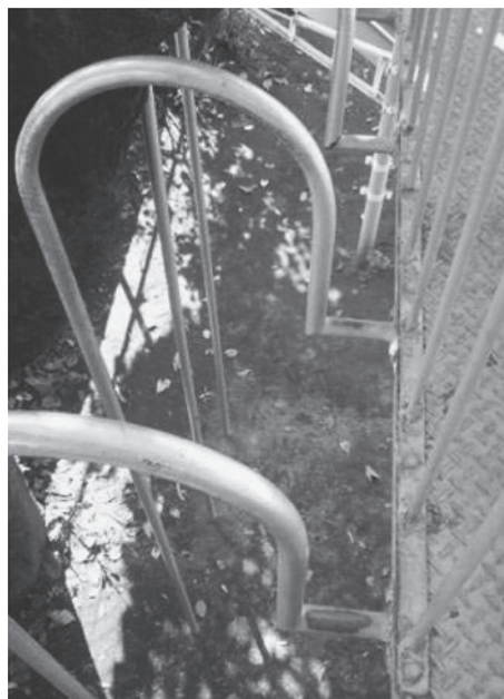
写真4 患児の前頸部が引っかかったのぼり棒上部の水平部分