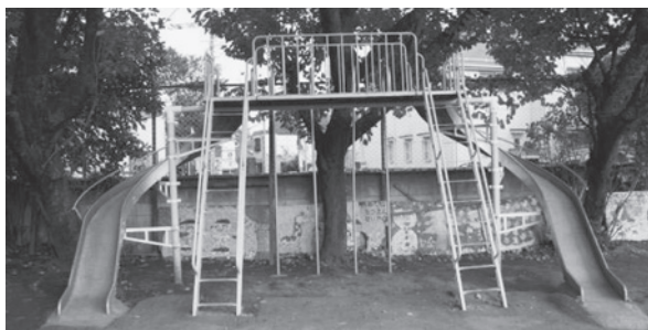
写真1 遊具の全体像