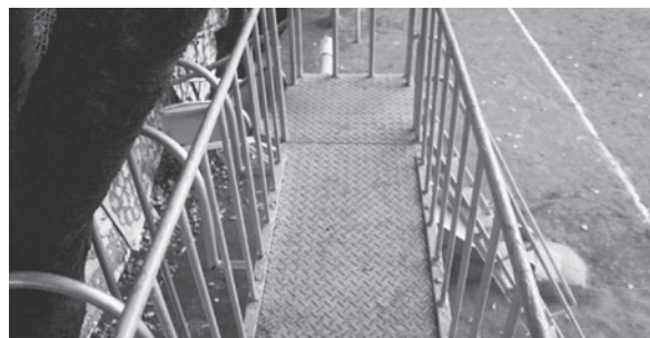
写真2 遊具上部の鉄板と両面の柵。写真左にのぼり棒が一部見える。