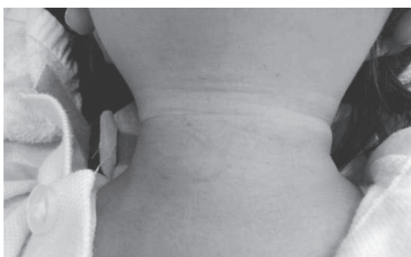
写真5 頸部前面の出血斑