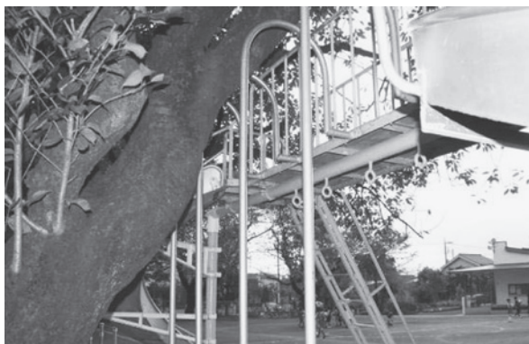
写真3 遊具を後方からみた写真