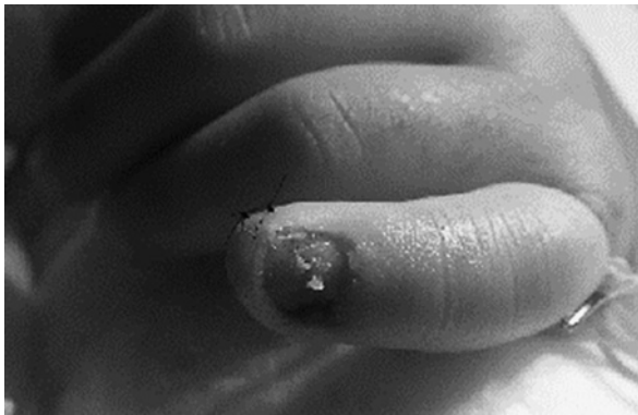
図3 挫創部縫合後 小指の挫創縫合後、爪体を除去している。