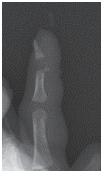
図4 左示指単純X線写真 末節骨転位および、中節骨骨折を認める