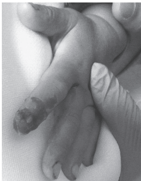
図3 受傷した左示指 爪床と指尖部背側の欠損、および、末節骨遠位端の露出を認める