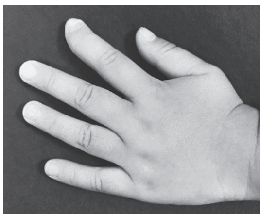
図5 受傷から約3か月時点の左示指