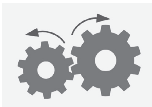
図6 同じメーカーの現在販売中の田植機の歯車部分の構造 外側に回転する構造として巻き込まれ防止対策としている

を負った、本例と全く同じ受傷原因の報告がある 1) 。農業・食品産業技術総合研究機構の農作業安全情報センターは、こどもを同乗させる、膝の上に乗せる、運搬車の荷台に乗せることは禁止事項であることを喚起している 2) 。乗用農業機に幼児である孫を同乗させて運転していた際に、川に機器ごと転落した、同乗させていたこどもが墜落して機器に轢かれる、ロータリーに巻き込まれる、体勢を崩したこどもをとっさに支えようとしてハンドル操作を誤るなどの事故が毎年発生していることを例に挙げて複数回の注意喚起をしている 2)3) 。